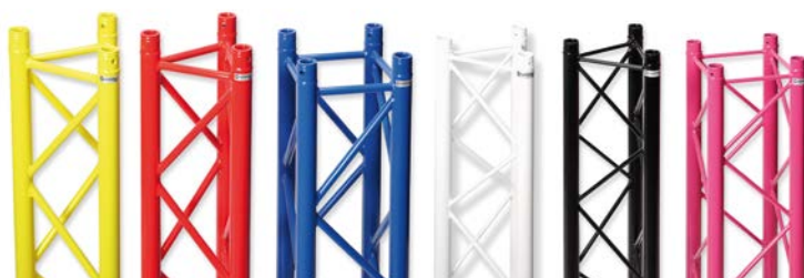
Tableau de charge